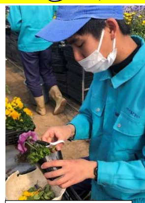
傷んだ葉や花をきれいにカット