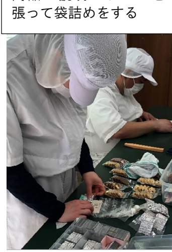
商品の説明のラベルを張って袋詰めをする