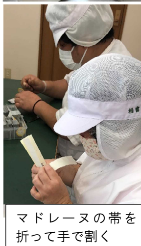
マドレーヌの帯を折って手で割く