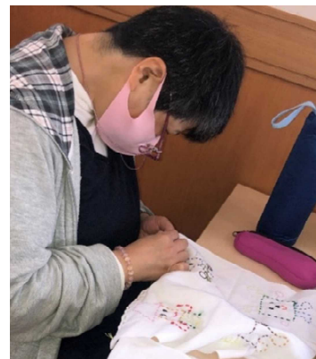
一針一針丁寧にふきんに刺繍をしていきます