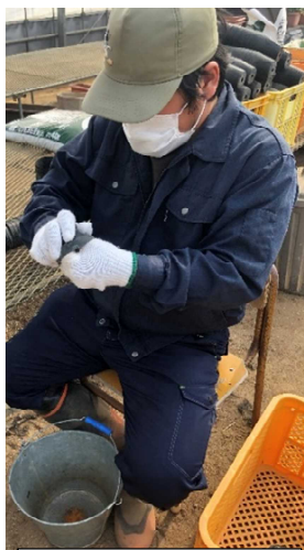
軍手でポットをきれいに拭く