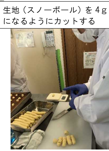
生地（スノーボール）を 4g になるようにカットする