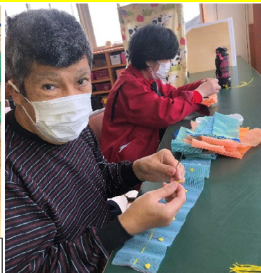
重ねた布に待ち針を打ち、真ん中を縫います