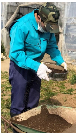
土をふるいにかける