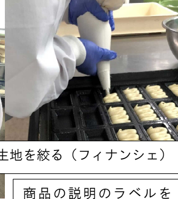
生地を絞る（フィナンシェ）