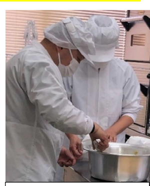
ごまぼうろの生地作り