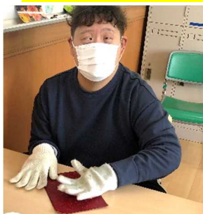
革を拭いてなめし、色落ちを防ぎます