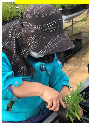
ポットに土を入れる