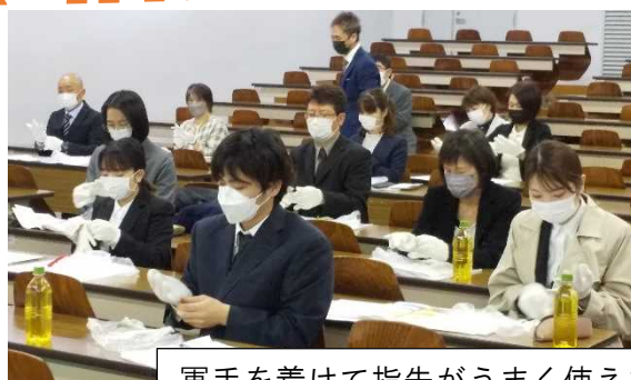
軍手を着けて指先がうまく使えないという疑似体験をするみなさん

皆さんとても集中されて聞き入っているようで、福祉に関わる仲間として、今後への期待と心強さを感じた研修会でした。