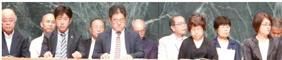
第13期役員 of 皆さん