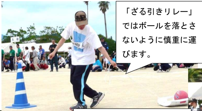
「ざる引きリレー」ではボールを落とさないように慎重に運びます。

5月20日（日）、諫早市多良見町のなごみの里運動公園で第40回長崎県ゆうあいスポーツ大会が開催されました。海のそばにあり、さわやかな風が吹き抜ける公園には県下の事業所や各地域の育成会が集まり、16の競技で勝敗を競いました。長崎市育成会からは「さんらいず」と「ワークあじさい」、そして会員枠で参加した本人、家族、職員、ボランティア計132名が参加しました。活水、純心、女子短期大から22名にボランティアとして来ていただき、みなさんと交流しながらサポートしていただきました。