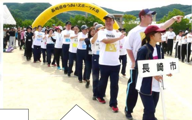
最後は参加者、ボランティア、職員も一緒に列になって踊りながらフィールド内に整列しました。