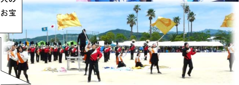
お昼の休憩時には長崎日大高校吹奏楽部のみなさんによるマーチングが披露され、音楽に合わせてノリノリで踊る人もいました。