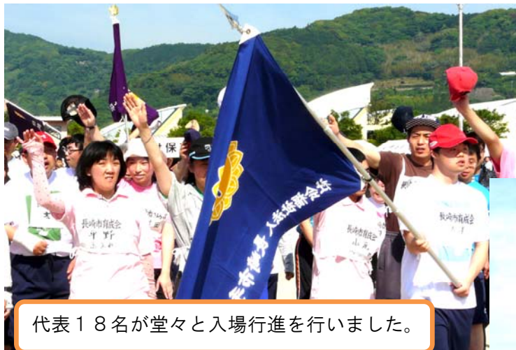
代表18名が堂々と入場行進を行いました。

なごみの里運動公園(諫早市多良見町)にて第39回長崎県ゆうあいスポーツ大会が開催されました。長崎市育成会からは130名が参加し、五月晴れの空の下、様々な競技を楽しみました。