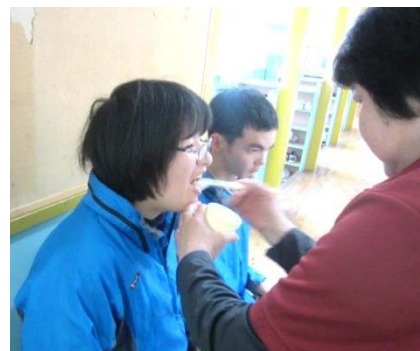
職員による仕上げ磨きや染め出し液を使った磨き残しチェックも行われています。